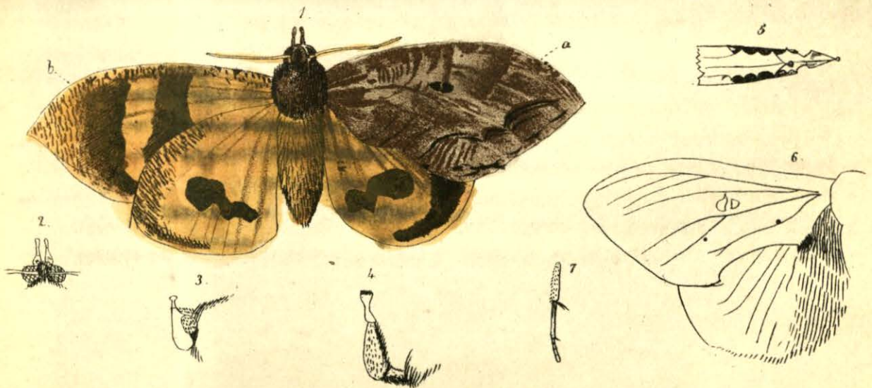
Ophideres Raphael , (Alfr. Dugès)