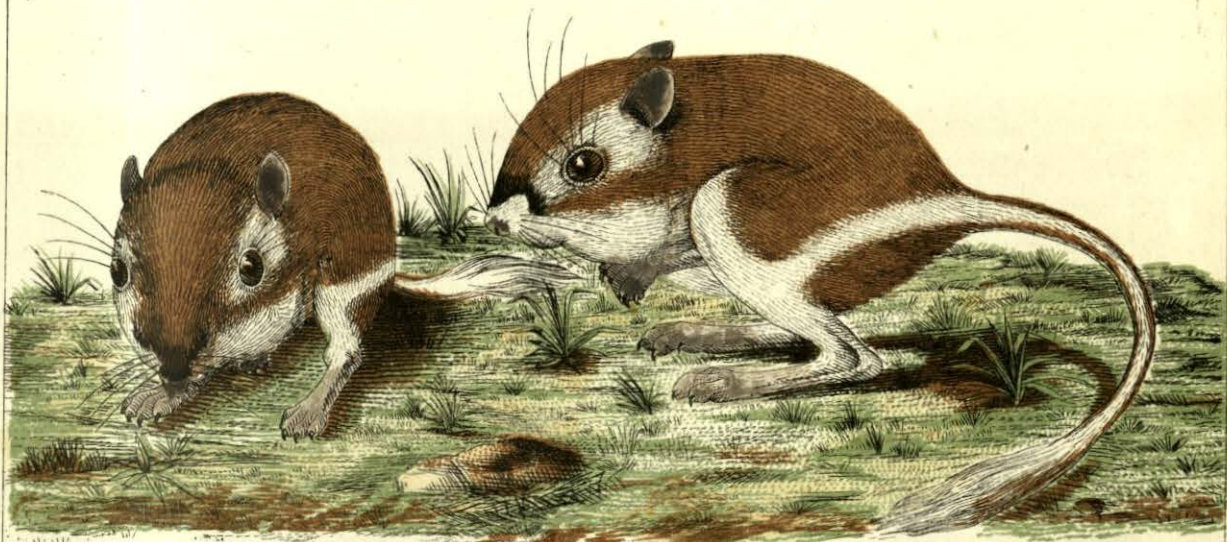
Dipodomys Phillipsi , Gray. A. Dugès. dib.