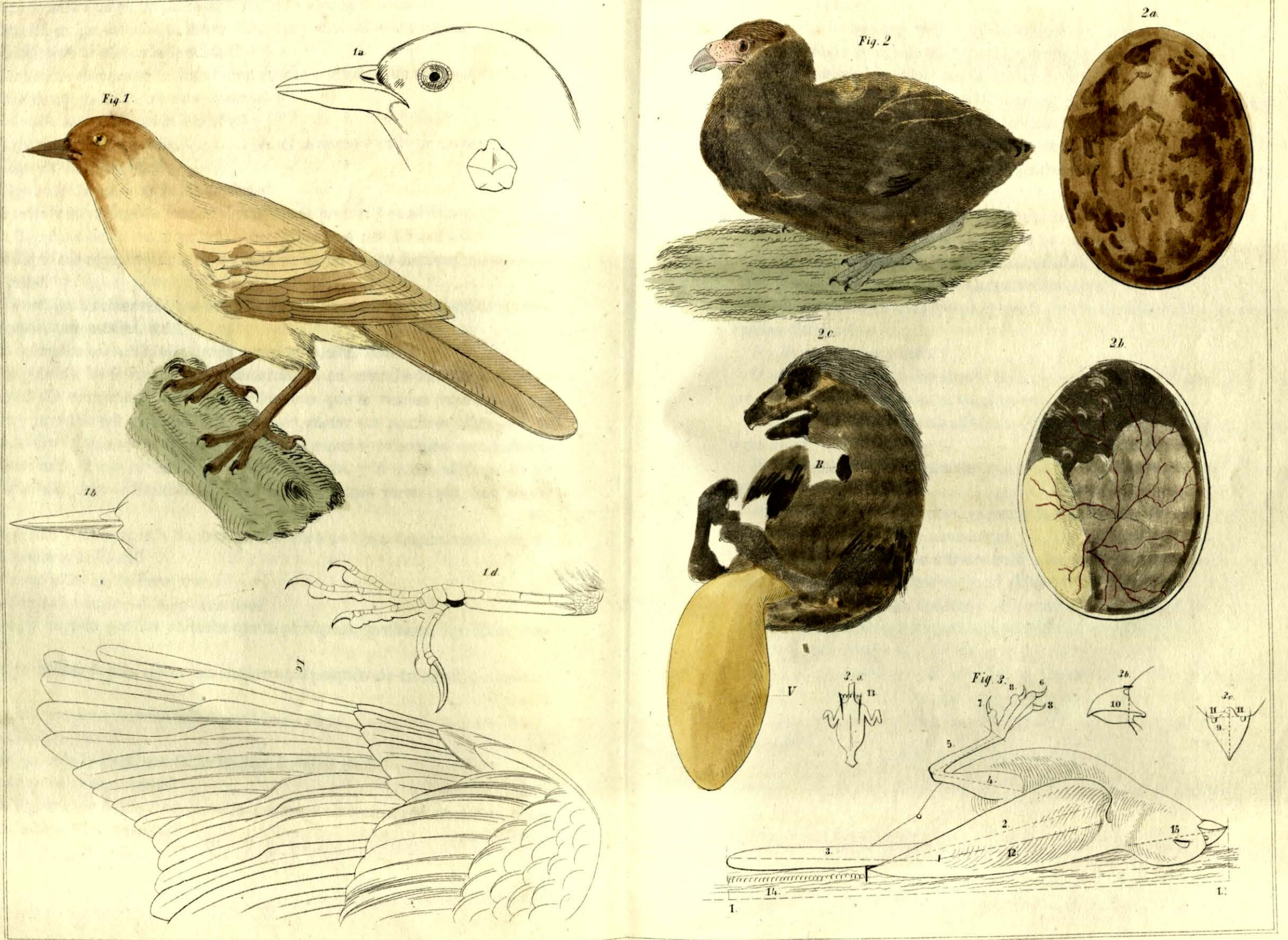
Figuras relativas à trabajos de ornitologia del Dr. A Dugès.